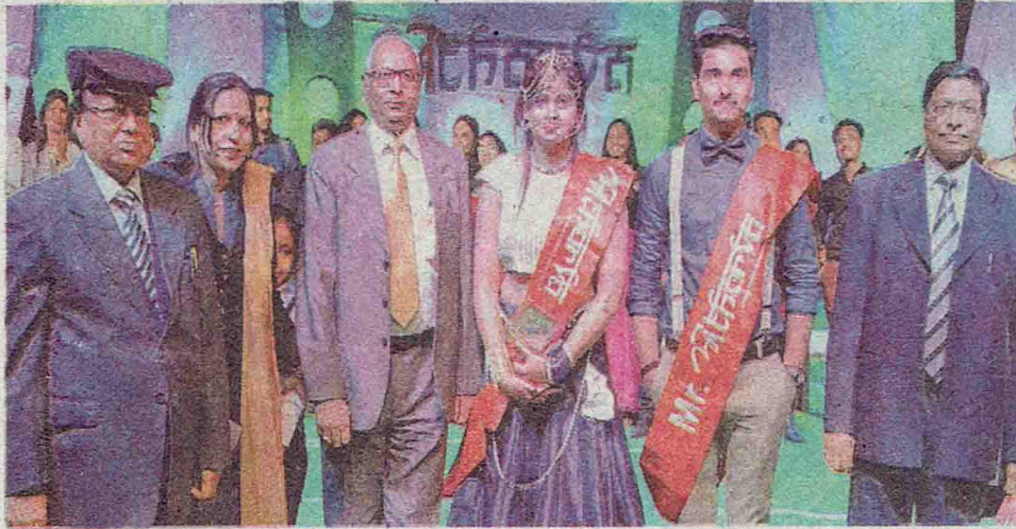
मिवि में मिस्टर अथर्वा व मिस अथर्वा विवि के अधिकारियों के साथ • जागरण