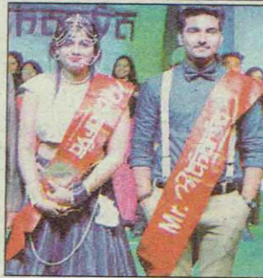
वार्षिक महोत्सव में चुने गए मिस और मिस्टर अथर्वा।