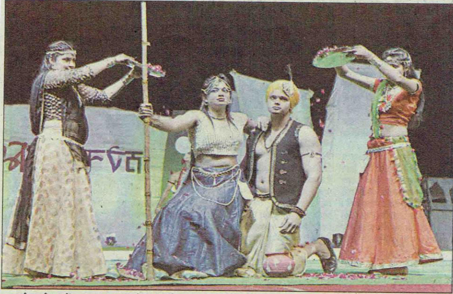
अथर्वा कार्यक्रम में नाटक प्रस्तुत करते विद्यार्थी।