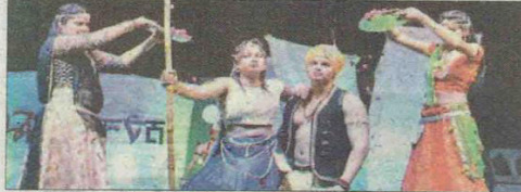
मंविवि में अथर्वा के दौरान सांस्कृतिक कार्यक्रम प्रस्तुत करते छात्र-छात्राएं।