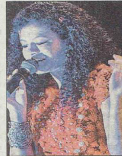
कार्यक्रम के दौरान प्रस्तुति देती बालीवुड कलाकार।